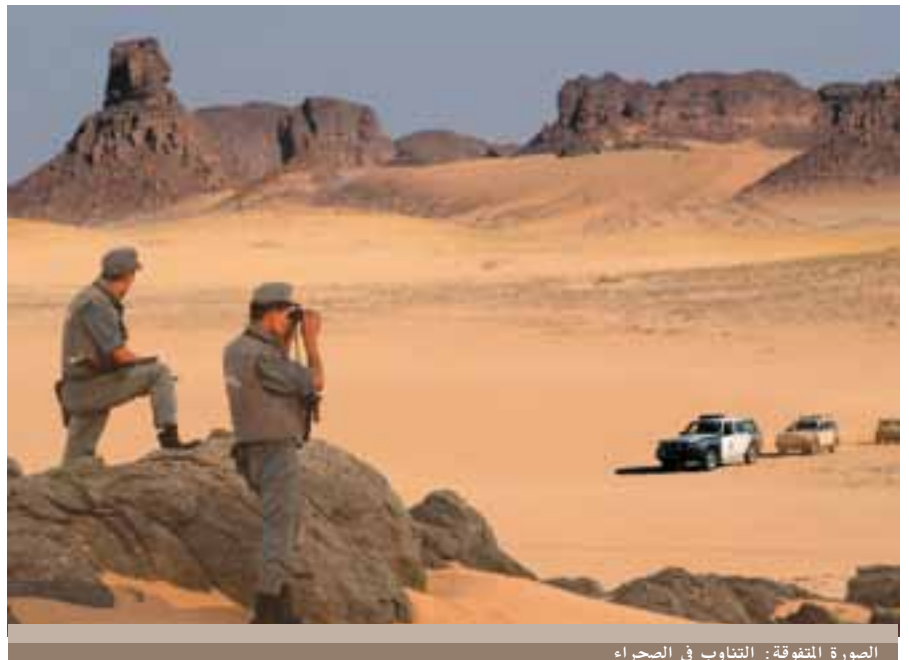
الصورة المتفوقة: التناوب في الصحراء

و تجدر الإشارة إلى أن أعضاء منظمة الجمارك العالمية بلغ عددها 177 بلدا عضوا.