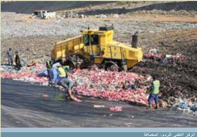
المركز التقني للردم، لصفافة

على هامش المؤتمر الوطني الخامس لإطارات الجمارك، التي عقدت بولاية تلمسان من 12 إلى 14 جوان 2011 ، اشرف المدير العام للجمارك، السيد محمد عبدو بودريالة برفقة والي ولاية تلمسان، السيد نوري عبد الوهاب على عملية إتلاف أكثر من 16000 خرطوشة سجائر ذات العلامة الأجنبية ، و كمية كبيرة من مادة الشمة بقيمة إجمالية 8901940.00 دج