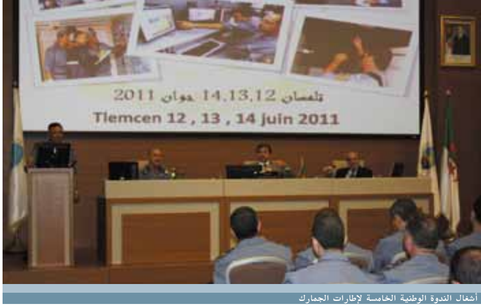
أشغال الندوة الوطنية الخامسة لإطارات الجمارك

”فكرة برنامج العصرنة 2007-2010 هي الانتقال من التسيير الكلاسيكي و الروتيني ، دون أهداف مسطرة ... إلى أسلوب تسيير إداري له أهداف و نتائج لايد من بلوغها “ قال المدير العام للجمارك.