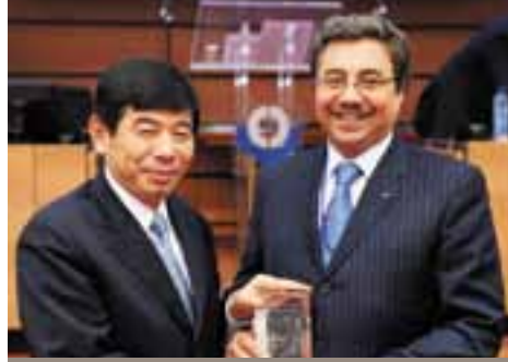
تسليم جائزة مسابقة أحسن صورة فوتوغرافية لسنة 2011 للمنظمة العالمية للجمارك

لقد تحصلت إدارة الجمارك الجزائرية، على جائزة الطبعة الثالثة لمسابقة أفضل صورة ، التي نظمتها المنظمة العالمية للجمارك لعام 2011، بمناسبة استضافة الدورتين 117 و 118 لمجلس التعاون الجمركي للمنظمة العالمية للجمارك في بروكسل من 23 إلى 25 جوان 2011 .